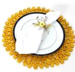
Souplats Expositor: Detalhes de Classe