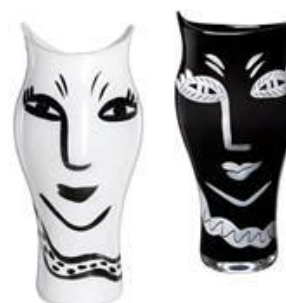
Open Minds Vaso Expositor: St. James