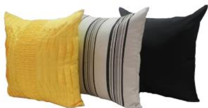
Almofadas Expositor: Decorare