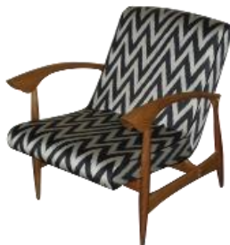
Poltrona Anos 50 Ikat Seda Expositor: Szalay