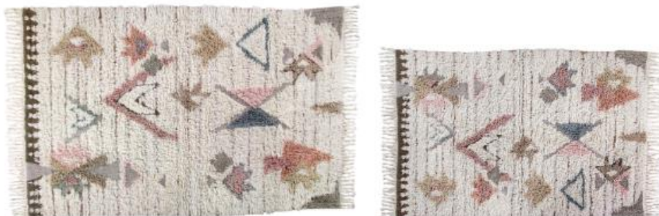
Modelo Tuba da coleção Woolable by Lorena Canals 170 x 240 cm [550€] e 140 x 200 cm [375€]

O modelo Tuba foi inspirado nos símbolos místicos dos índios norte-americanos. Composto por cores elegantes transforma qualquer lugar da sua casa em uma decoração boêmia e chique. A base retangular tingida na cor linho, ligeiramente visível através da lã, dá um efeito 3D.