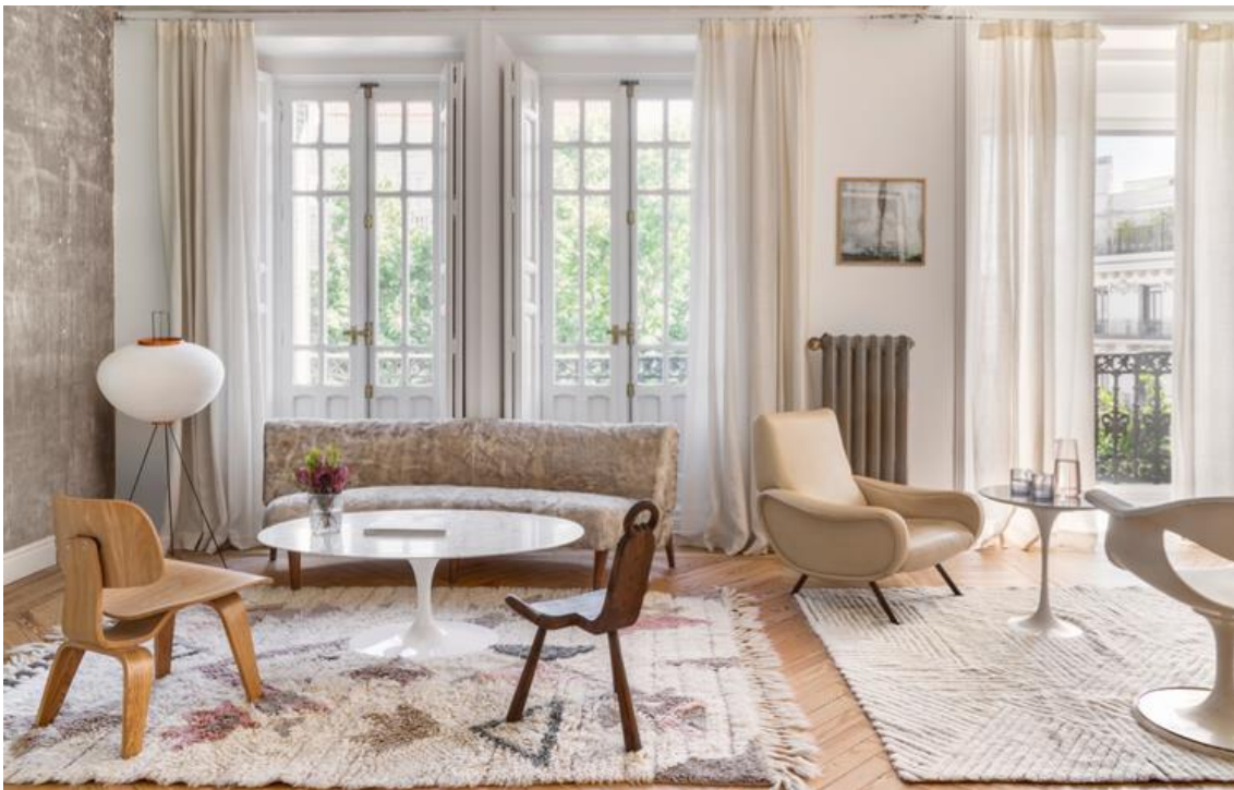
Modelo Tuba da coleção Woolable by Lorena Canals 170 x 240 cm (550€)

Ao longo dos anos, a Lorena Canals se tornou uma das marcas mais conhecidas do setor têxtil, graças à ao conceito de tapetes laváveis em casa. Após 20 anos de experiência, a designer revoluciona mais uma vez o mercado têxtil, com Woolable by Lorena Canals, os primeiros tapetes laváveis de lã, feitos um por um, pelos artesãos e artesãs da Índia, selecionando a melhor qualidade das fibras de lã.