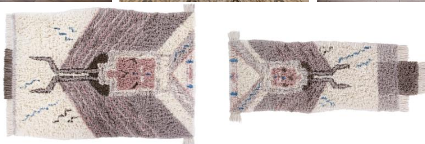
O modelo Zuni da coleção Woolable by Lorena Canals 170 x 240 cm [595€] e 90 x 240 cm [325€]

O modelo Tuba foi inspirado nos símbolos místicos dos índios norte-americanos. Composto por cores elegantes transforma qualquer lugar da sua casa em uma decoração boêmia e chique. A base retangular tingida na cor linho, ligeiramente visível através da lã, dá um efeito 3D.