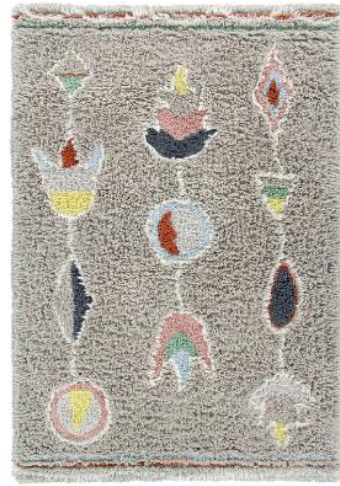
Modelo Arizona da coleção Woolable by Lorena Canals 170 x240 cm [575€]

Os tapetes redondos Hokan , Bannock e Chinook , tem lã curta com áreas de lona de algodão, na cor linho. Já os desenhos, são inspirados nas tendas emblemáticas artesanais da tribo Hopi. O modelo tem uma essência boêmia e natural, finalizado com tranças de lã natural feitas à mão. "Sempre acreditei que tudo precisa ter sua própria identidade, uma alma interior que a diferencia das outras." - Lorena Canals.