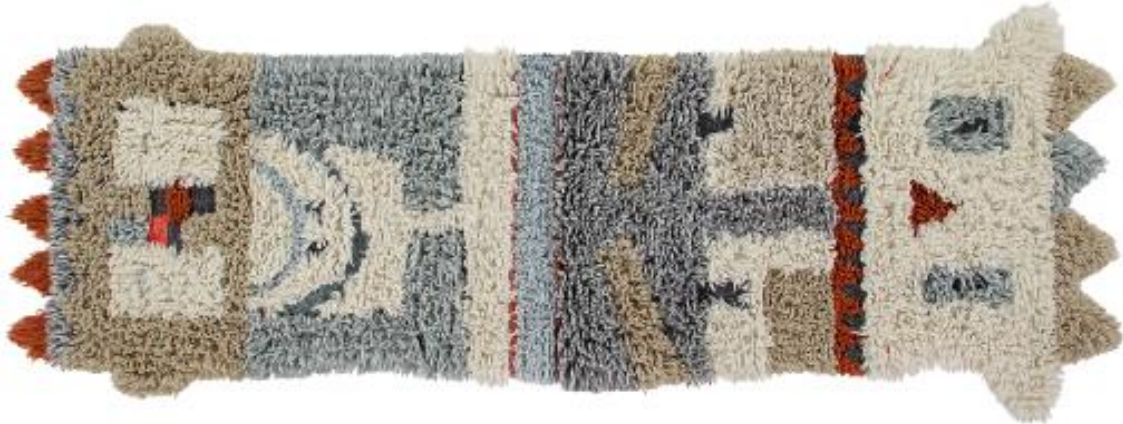
Modelo Kachina da coleção Woolable by Lorena Canals 90 x 240 cm (295€)