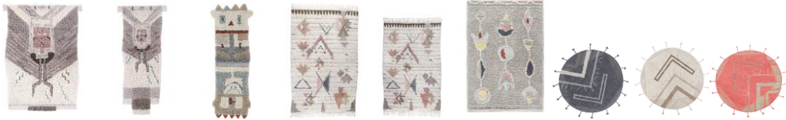
Tapetes de lã lavável Zuni 170 x 240 cm (595€) e 90x240cm (325€); Kachina 90 x240 cm (295€); Tuba 170 x 240 cm (550€) e 140 x 200 cm (375€); Arizona 170 x 240 cm (575€) e Hokan 160 cm (265€); Bannock 160 cm (265€) e Chinook 160 cm (265€).

A Coleção Hopi é toda feita artesanalmente, um a um, pelos nossos artesãos, usando cores neutras e hippie; expressando assim, a história e os valores da tribo: alma, harmonia e sabedoria.