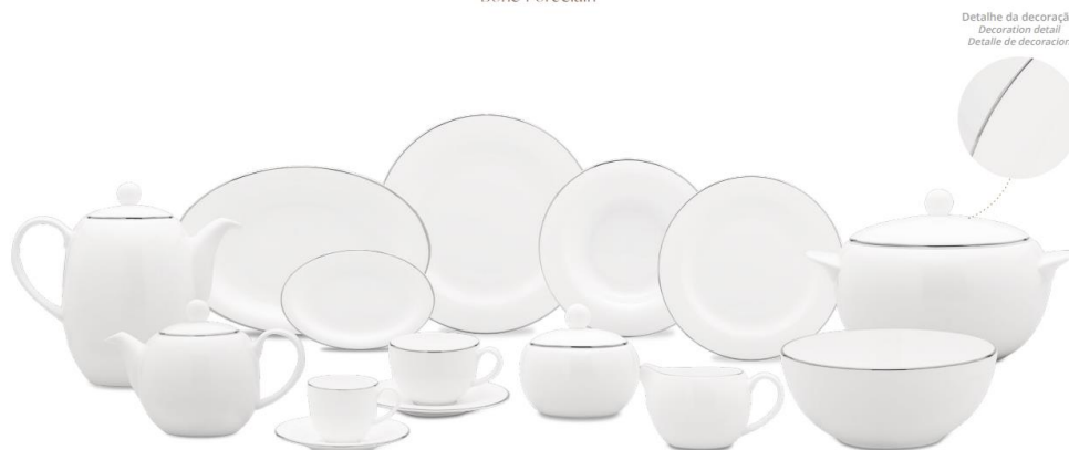
Aparelho de jantar em Bone Porcelain – decoração Silver – Filete Prateado