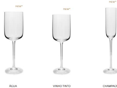
Coleção de taças feitas à mão – modelo 401

Vinho Tinto 401 - Taças que atravessam gerações sem perder a elegância. O modelo 401 são peças mais clean com design do bojo reto. São taças elaboradas em um processo de fabricação artesanal desde o sopro até a lapidação, transformando o puro cristal em verdadeiras obras de arte. São taças com mais transparência, brilho, sonoridade e porosidade da parede do cristal, características que estimulam os sentidos durante a degustação das bebidas, pois proporcionam mais aromas e sabores.