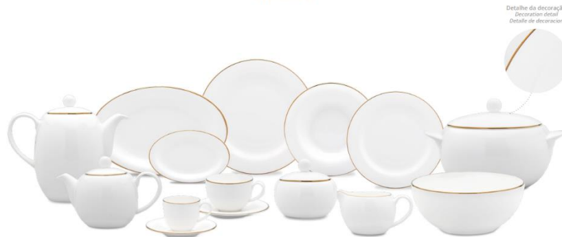
Aparelho de jantar em Bone Porcelain – decoração Gold – Filete Dourado