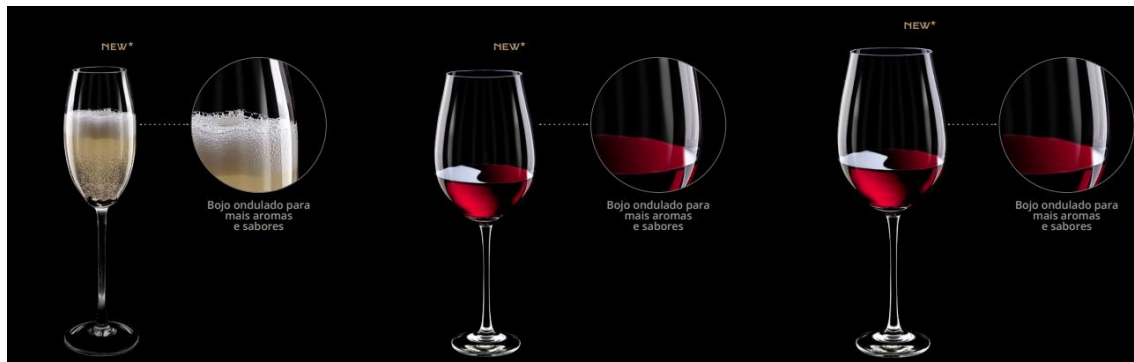
Espumante – Brunello di Montalcino – Bordeaux Grand Cru