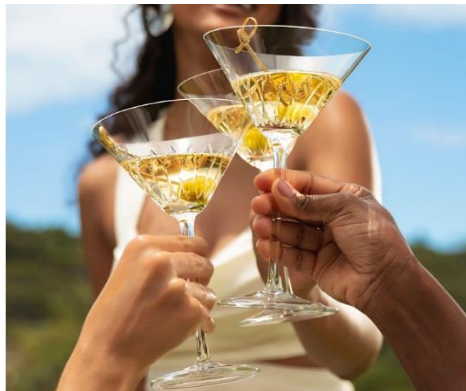
Taça Strauss feita à mão – modelo Dry Martini – decoração Blooming