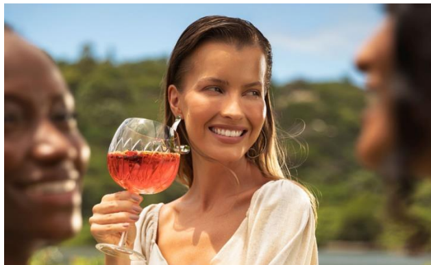
Taça Strauss feita à mão – modelo Gin– decoração Blooming