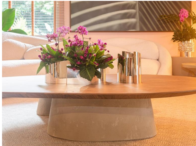
Coleção Bilbao – Leo Romano

A marca apresenta o lançamento oficial da Coleção Poli assinada por Camila Fix , Coleção Tumbira assinada por Fernanda Marques e Caixa Gin&Tônica Float assinada por Arthur Guimarães , além de suas principais linhas de produtos e peças de design assinado