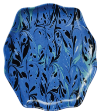
ref.: BJLAGMMBBLU material: porcelana cor: azul tamanho: 21x24x2CM