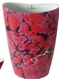
ref.: VSESTMBLPIK material: porcelana cor: rosa tamanho: 3x19x29cm

São travessas, potes, vasos, bandejas e acessórios produzidos em porcelana, com pigmentos importados e muito vibrantes, que depois de queimados em fornos profissionais e de altas temperaturas, ganham brilho e qualidade. Todos os itens são produzidos manualmente peça por peça, com muita habilidade, cuidado e carinho.