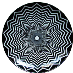
ref.: EUGG020 material: porcelana cor: preto e branco tamanho: 2,5x30cm