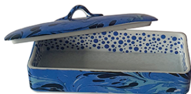
ref.: CXRMBLBLU material: porcelana cor: azul tamanho: 10x21x8CM